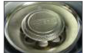
Ø 9,5 cm chrome powerfull burner