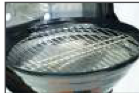
Stainless Steel Grill