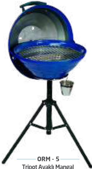
ORM - 5 Tripot Ayaklı Mangal Tripod Stand Brazier