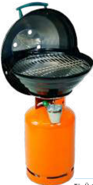
ORM 5 - 1 Tüp Üstü Premium Mangal Top Premium Grill