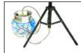
Metal Hose Connector